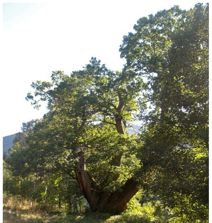
Castiñeiro en Castelo de Frades, con máis de 10 m de perímetro.

Abesedo de Donís, o bosque máis grande da Galiza. Durante moitos anos cortouse madeira de carballo e carba, para travesas de ferrocarril e construción naval. Os avesedos son bosques que medran nas abas sombrizas (avesías) orientadas ao norte.