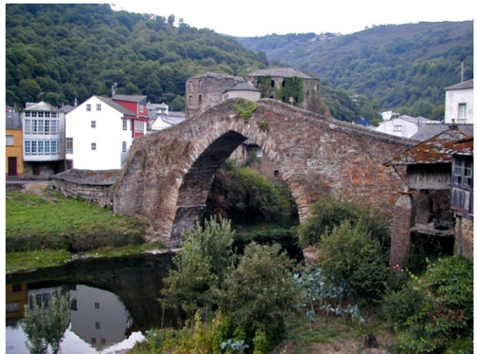
Ponte Vella e castelo de Altamira na Pobra de Navia. Hai referencias do castelo da Pobra de Navia do ano 1037. Desfeito nas revoltas irmandiñas foi restaurado e actualmente está adicado a vivendas.