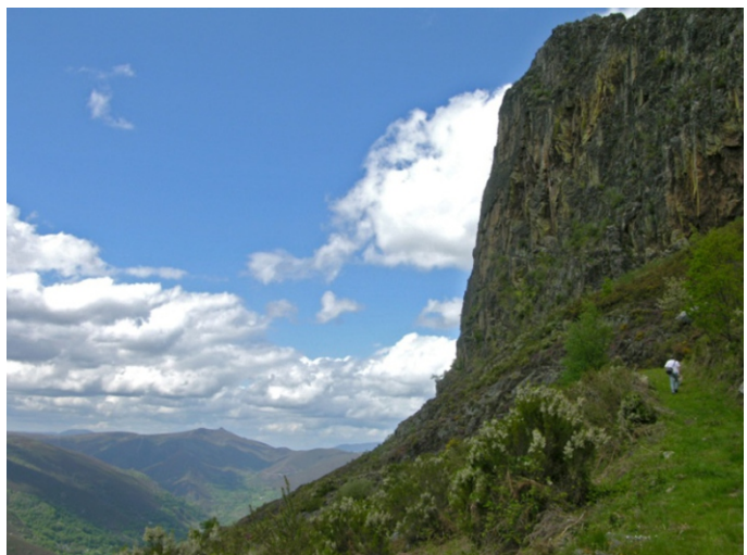
Penedo de Murias, unha formación de cuarcita que sobresaie na beira da serra do Brañal, sobre o val do rego de Murias.