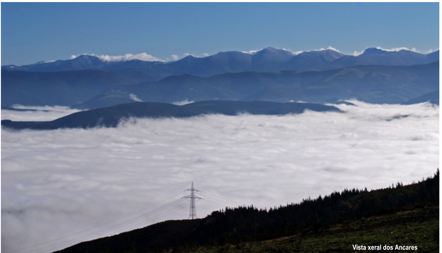
Vista xeral dos Ancares