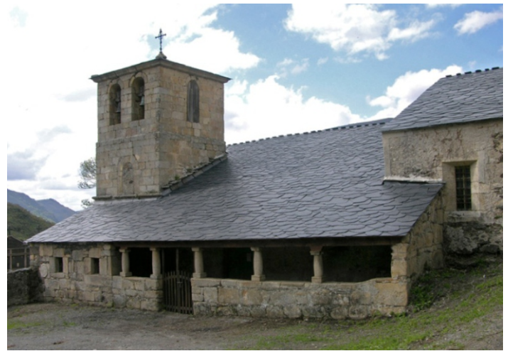
Igrexa de Donís.

En Pontes de Gatín hai un muíño e unha ponte medieval sobre o río Cervantes cunha curiosa lenda que fala do trato que fixo o demo (Gatín) cun mozo para que puidese cruzar o río a visitar á súa namorada.