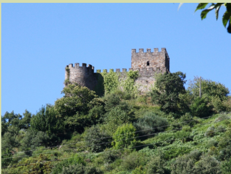
Castelo de Doiras.