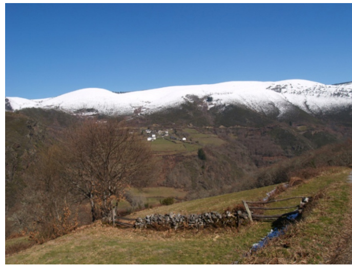
Paisaxe da zona de Quindous. Dúas terceiras partes do territorio dos Ancares teñen unha pendente superior aos 30°, polo que hai pouco espazo aproveitable para o cultivo.