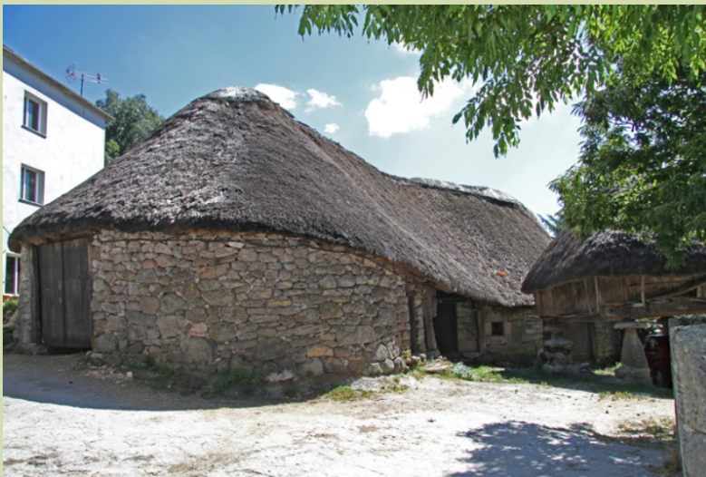
Piornedo: palloza e hórreo.

En Piornedo podemos facer unha visita completa á vila para coñecer o conxunto de pallozas mellor conservado dos Ancares na actualidade e visitar algunha das que están convertidas en museo.